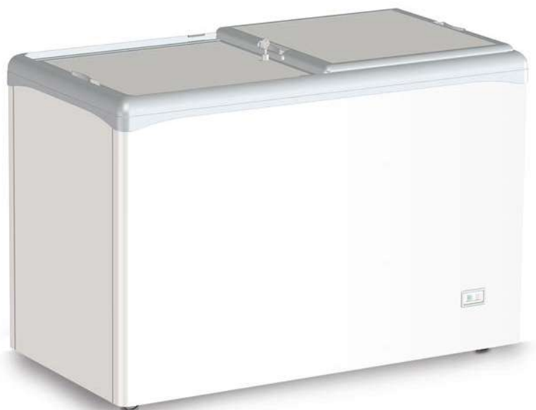
VIC 330 CCS