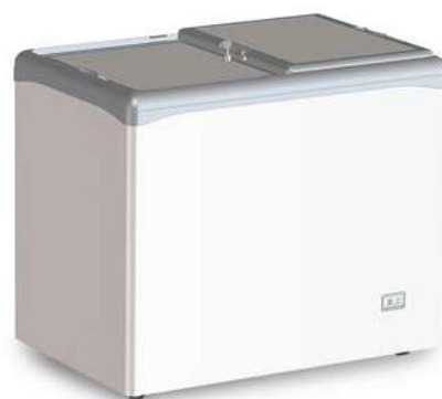
VIC 220 CCS