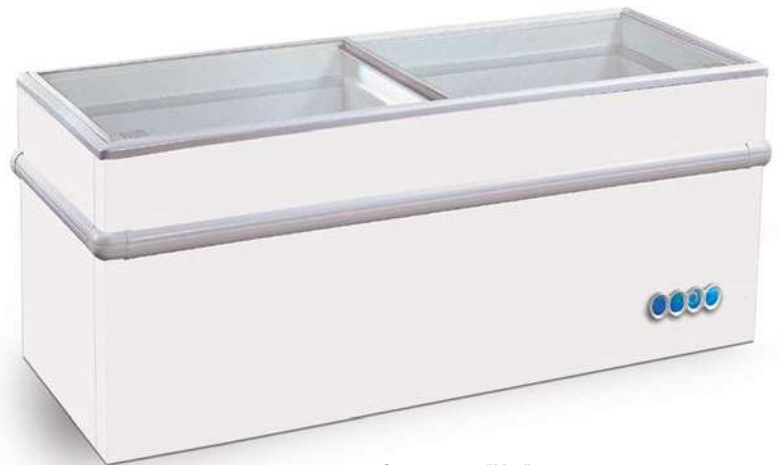
Gamma 150 “N.2”