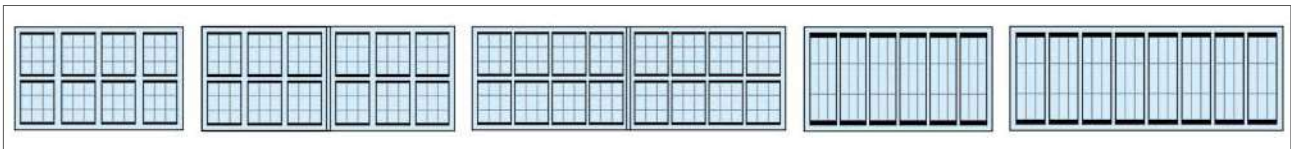
Gamma 150 "N.2"