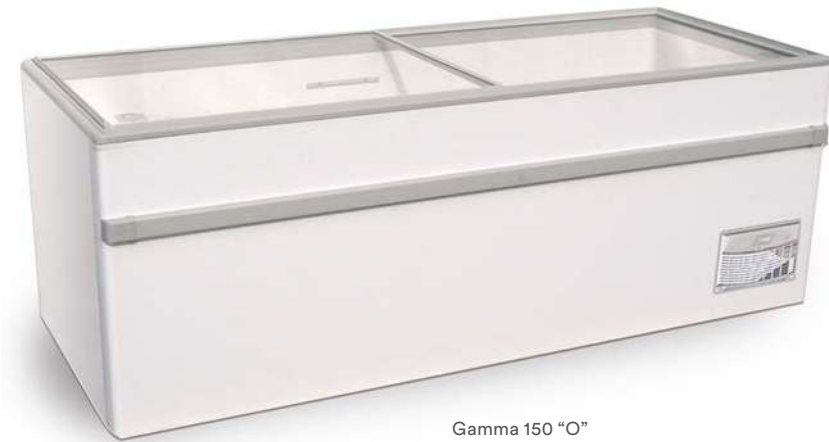
Gamma 150 “O”