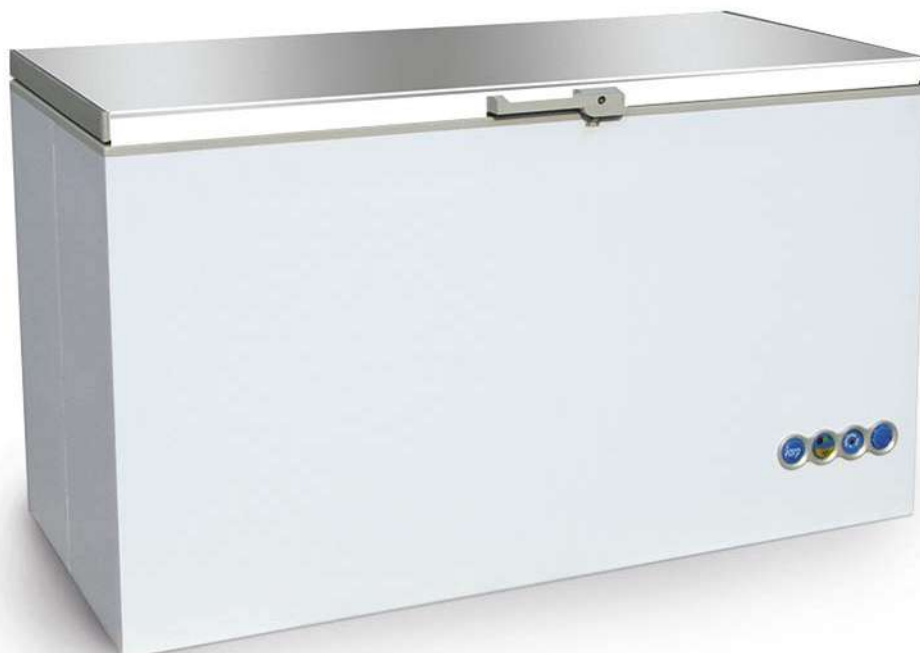
CF 700 Blanco (1 tapa)