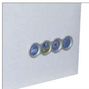
Cuadro de mandos.