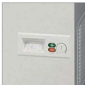
Panel de control de: termostato regulador temperatura y termostato analógico.