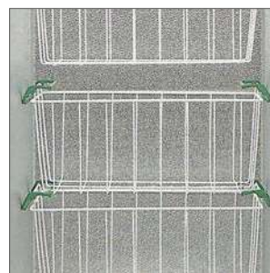
Posibilidad de apilar tres cestas.