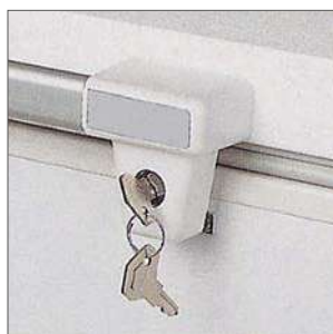
Cerradura y llave.