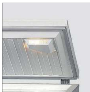
Luz automática a la apertura de la puerta.