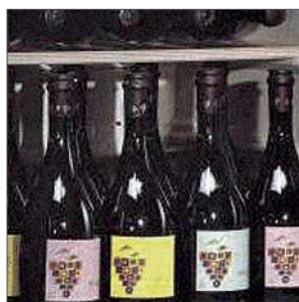
Interior en blanco y cristal de la puerta tintado.