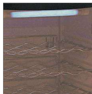
Iluminación interna superior y horizontal.