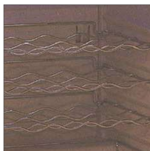
Estante metálico regulable en altura.