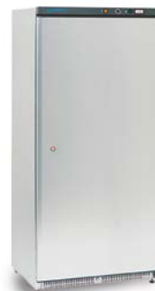
ABX 500 PV (Inox) (ventilado)