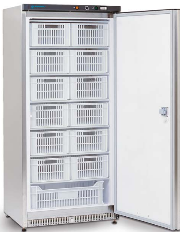
ABX 500 N (Inox) con cestas (estático)