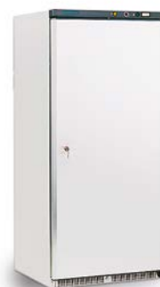
AB 500 N con cestas (estático)